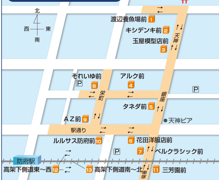
歩行者 地点別 5年前・前年比較